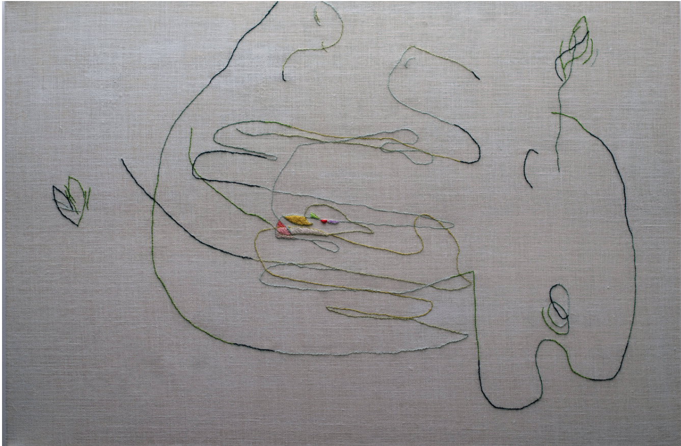
Græn kveðja, 100 x 150 cm, Ull á striga, 2024