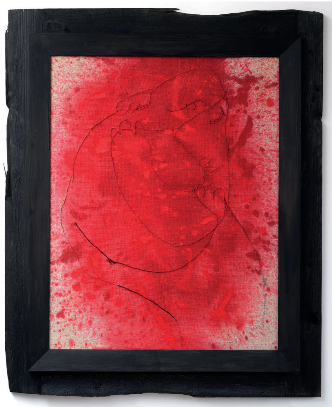
Rauður koss Ull á striga 124 x 153 cm