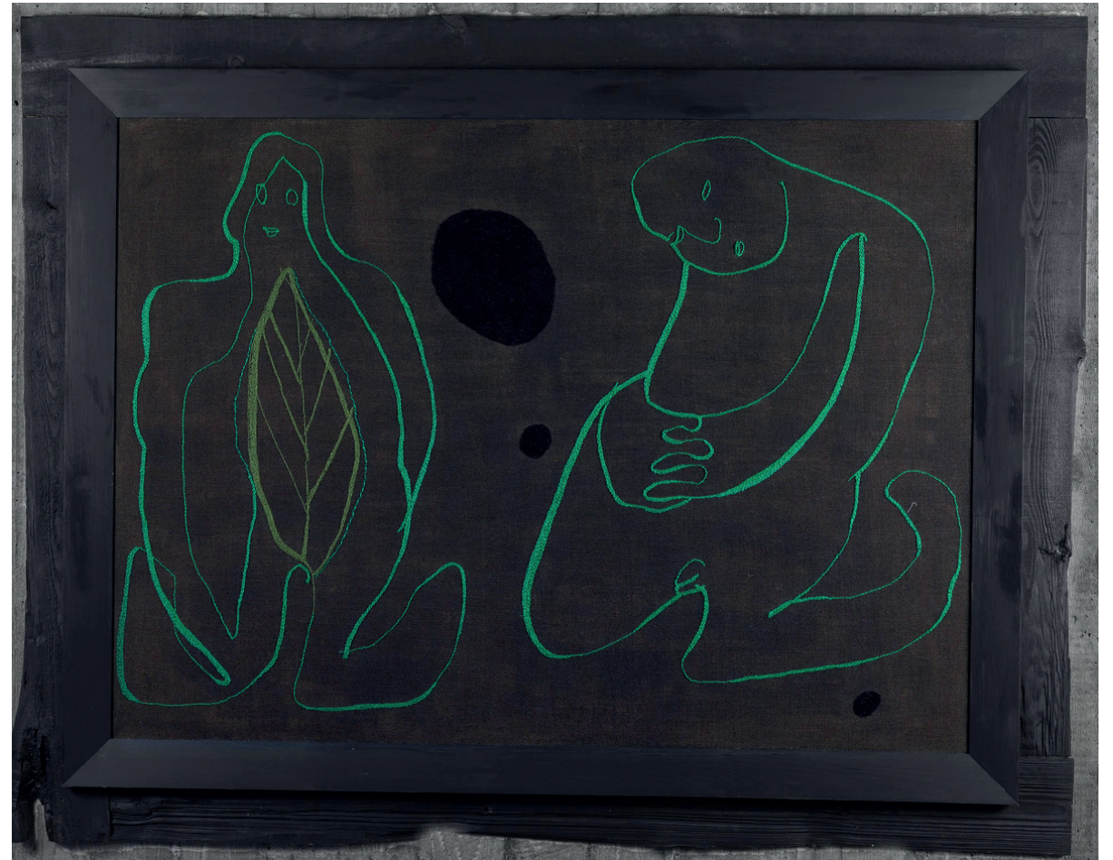
Kveðja í grænu og brúnu, Ull á striga, 145 x 185 cm, 2023