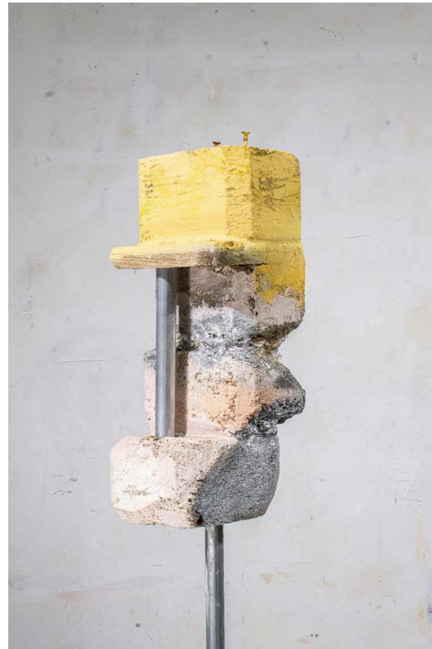
Ekki snerta, blandaðir miðlar á við, 14 x 14 x 154 cm, 2024