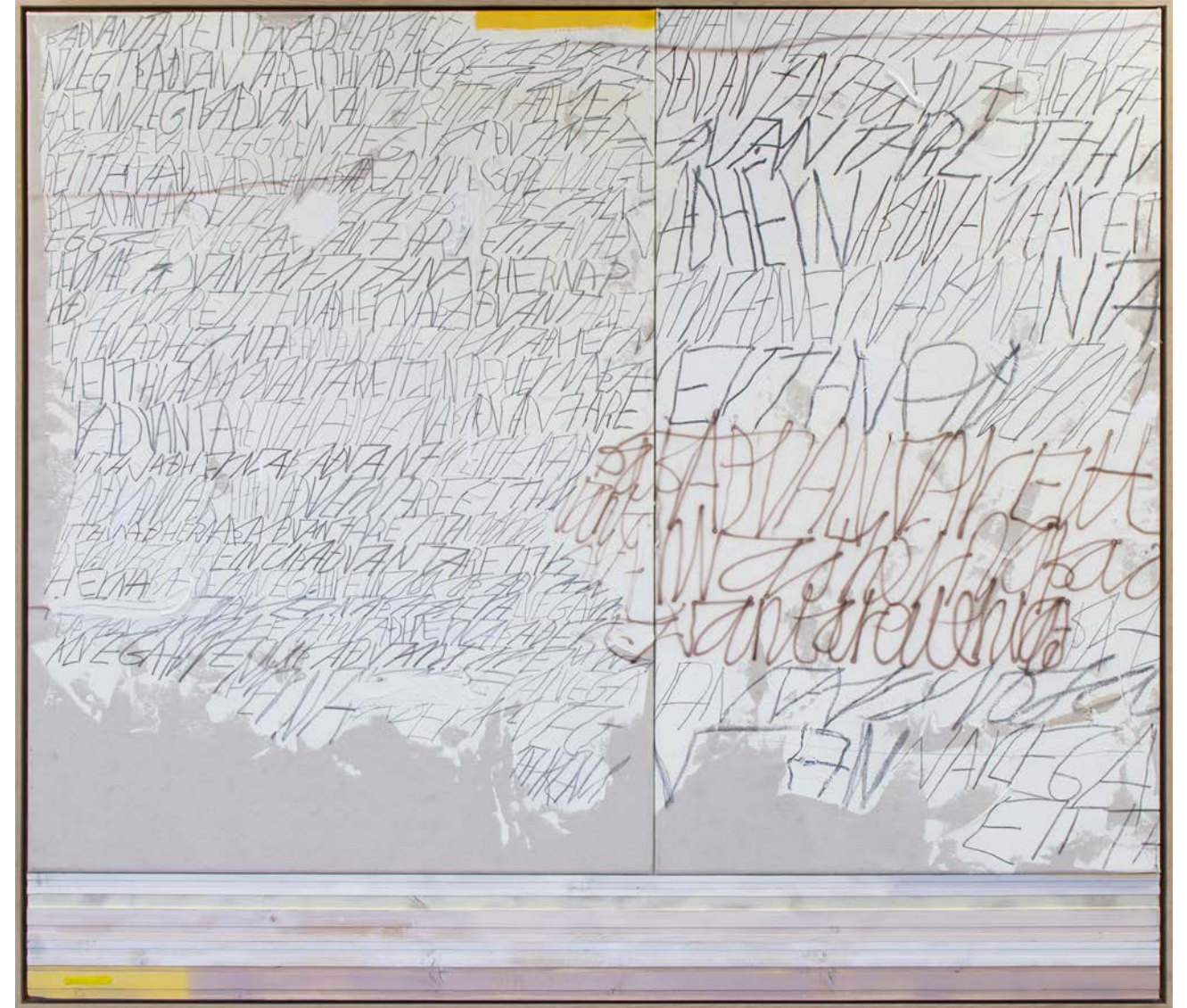
Það vantar eitthvað hérna, akríl og grafit á striga og við, 133 cm x 145 cm, 2023