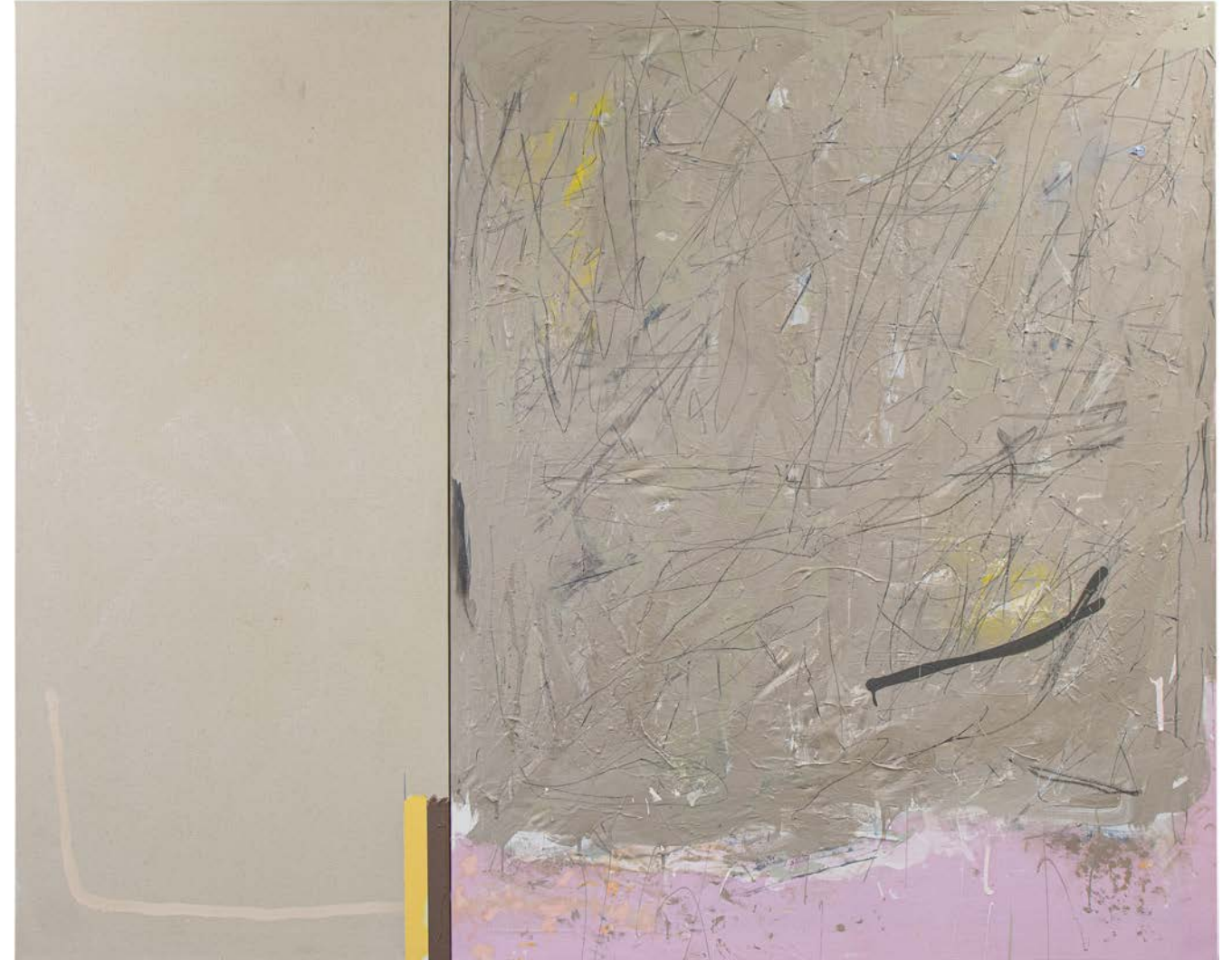
Volvox, akríl, enamel og grafit á striga, 120 cm x 150 cm, 2023