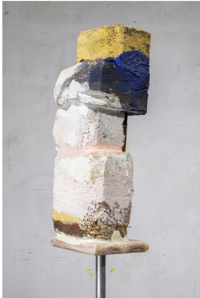
Ekki hlusta, blandaðir miðlar á við, 15 x 15 x 164 cm, 2024