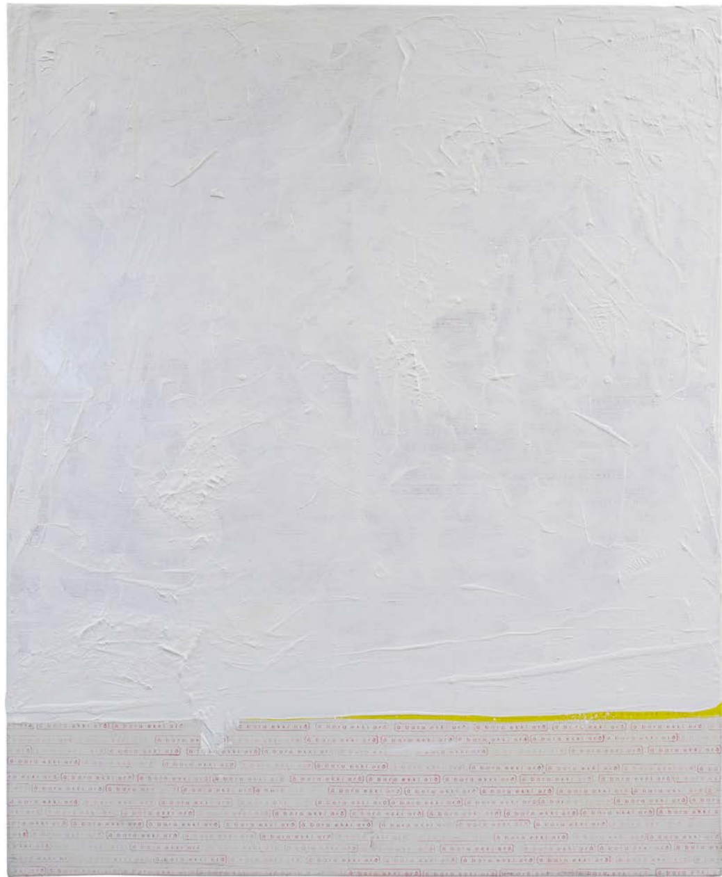
Á bara ekki orð, akríl og blek á linen, 110 cm x 90 cm, 2023