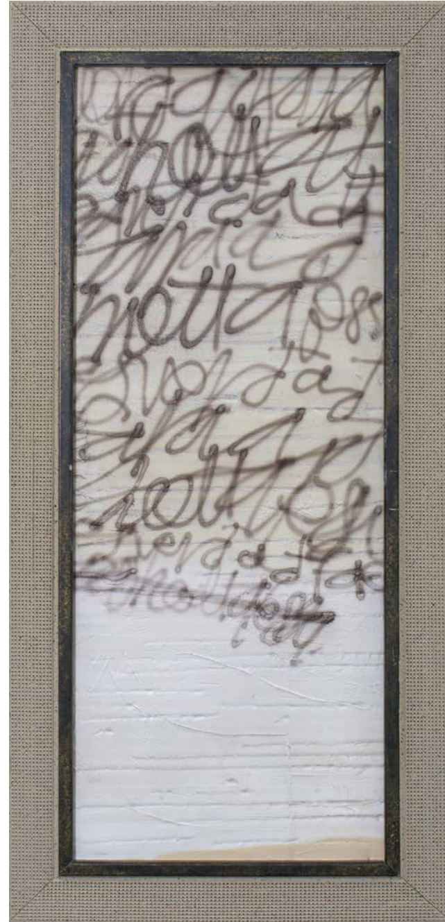
Hættu þessu, akríl og íblöndunarefni á pappa, 28 cm x 58 cm, 2023