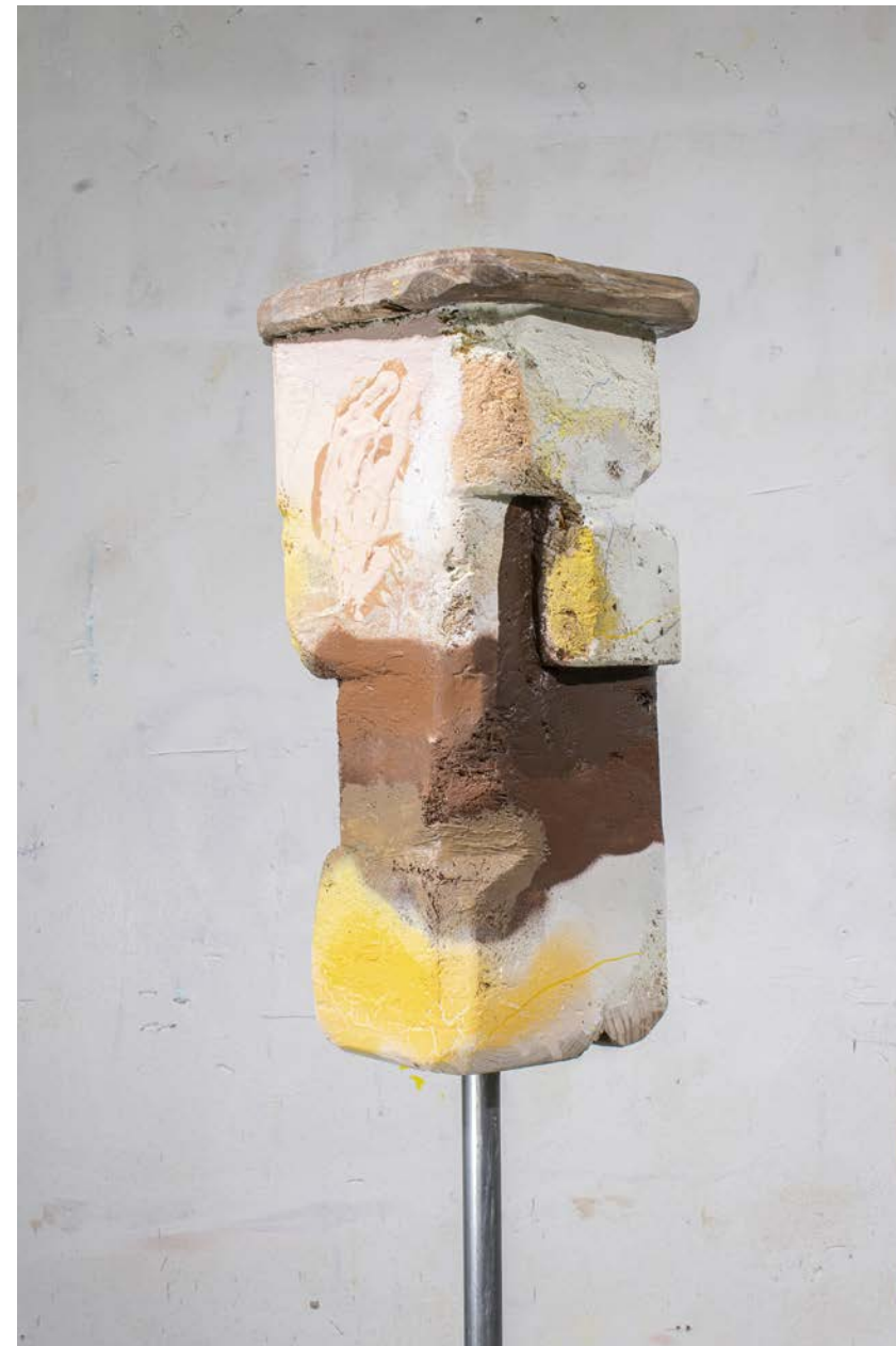
Ekki horfa, blandaðir miðlar á við, 17 x 16 x 158 cm, 2024