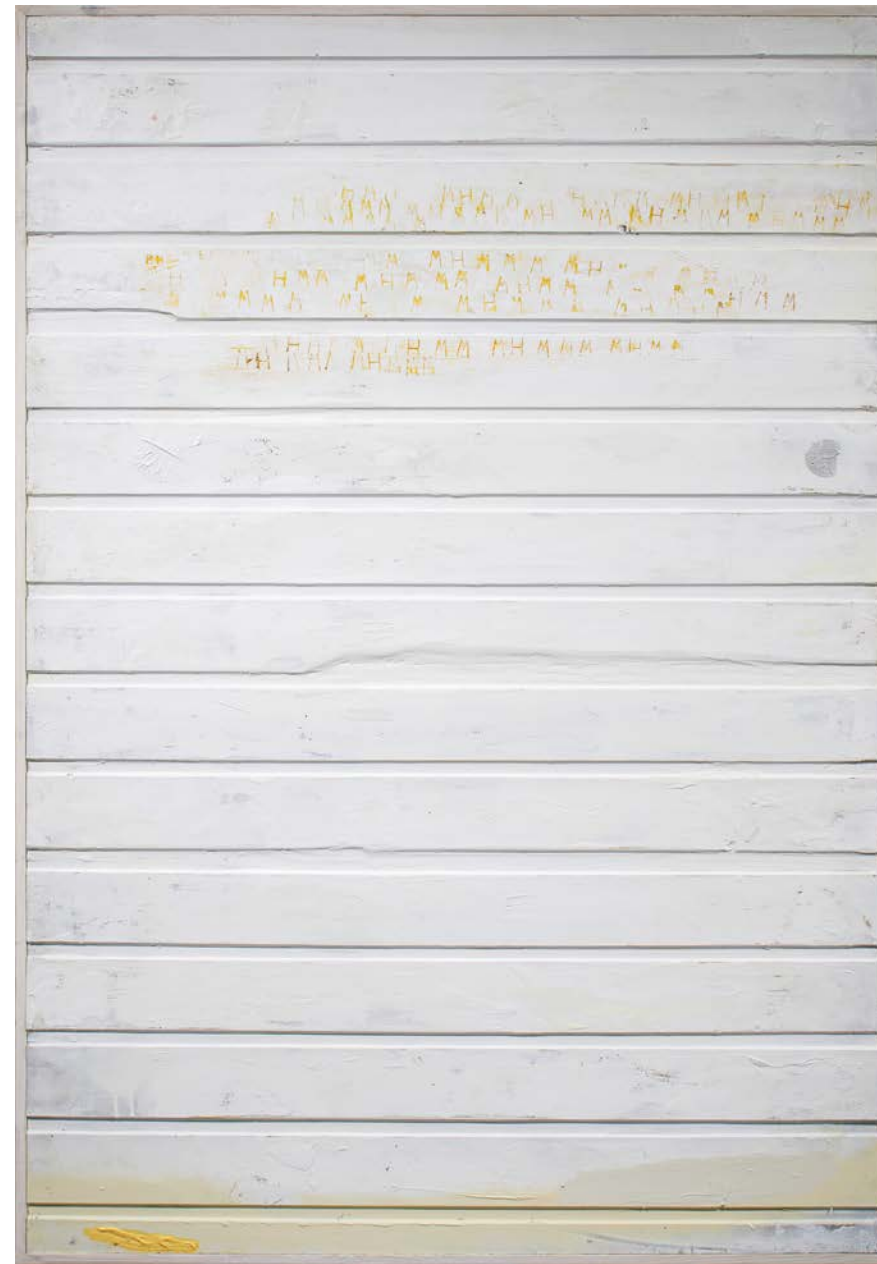
Mhmmm, akríl og enamel á við, 123 cm x 85 cm, 2023