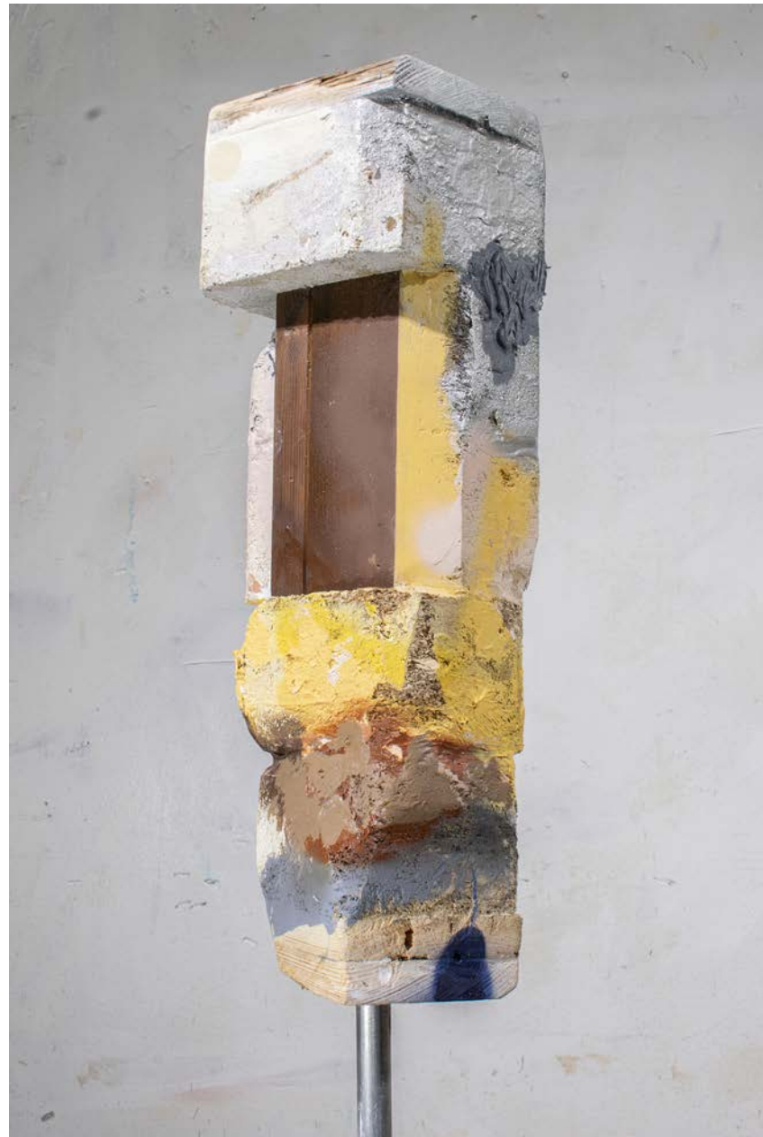
Ekki lykta, blandaðir miðlar á við, 15 x 15 x 164 cm, 2024