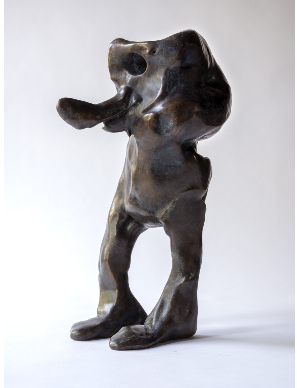
Nabbi, Bronssteypa, 45 cm, 2024