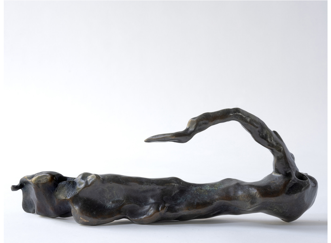
Ridill, Bronssteypa, 40 cm, 2024