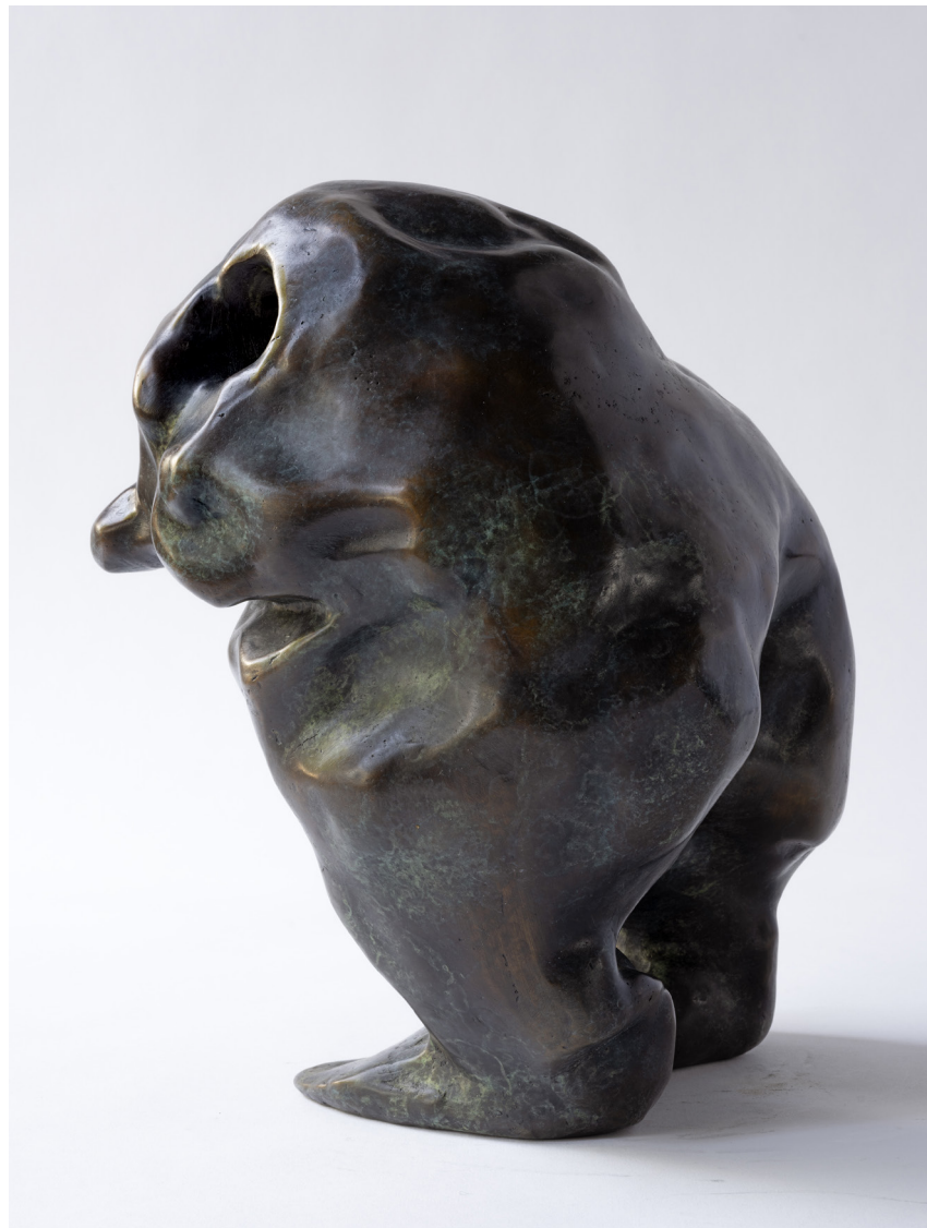
Túsl, Bronssteypa, 30 cm, 2024