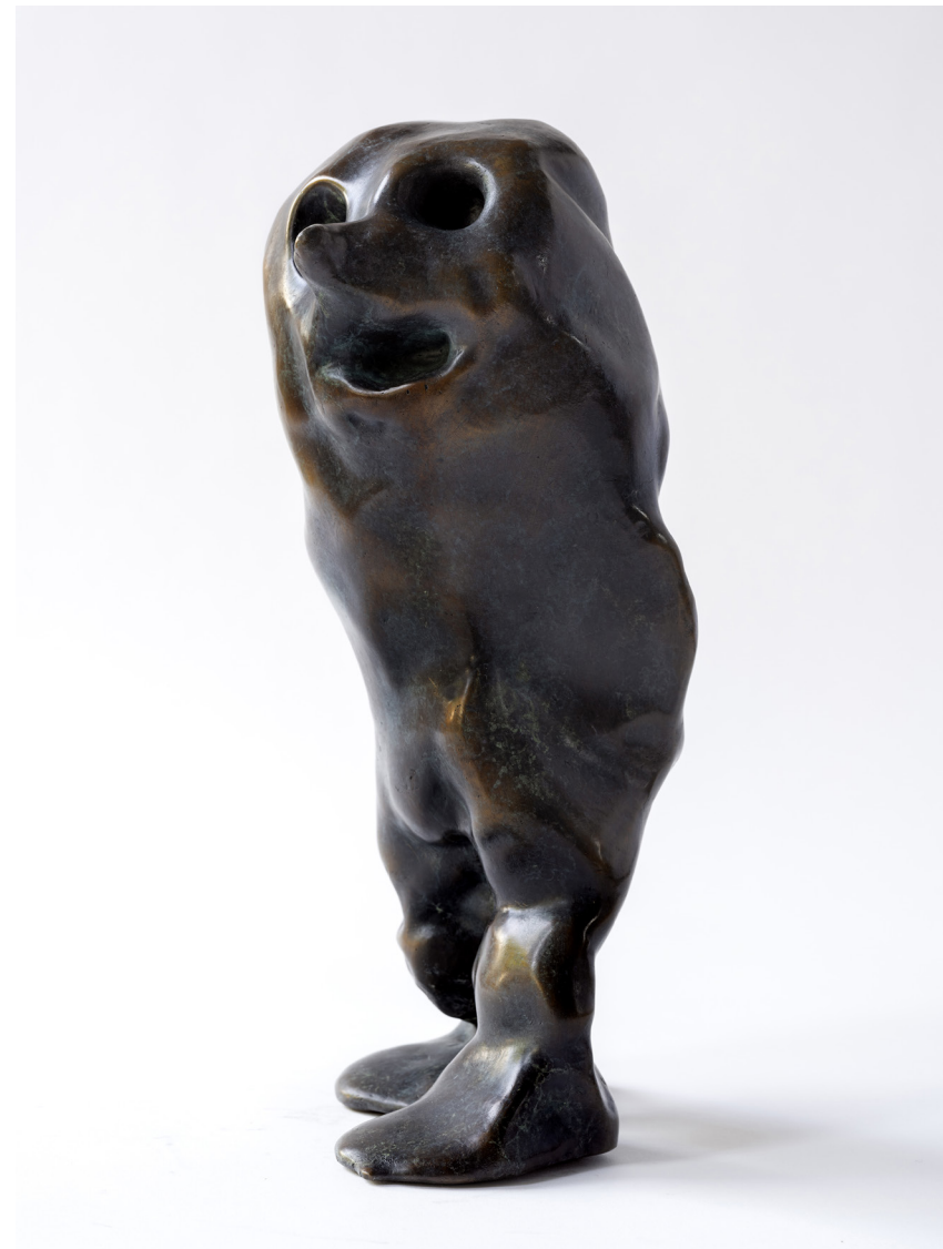
Túsl, Bronssteypa, 35 cm, 2024