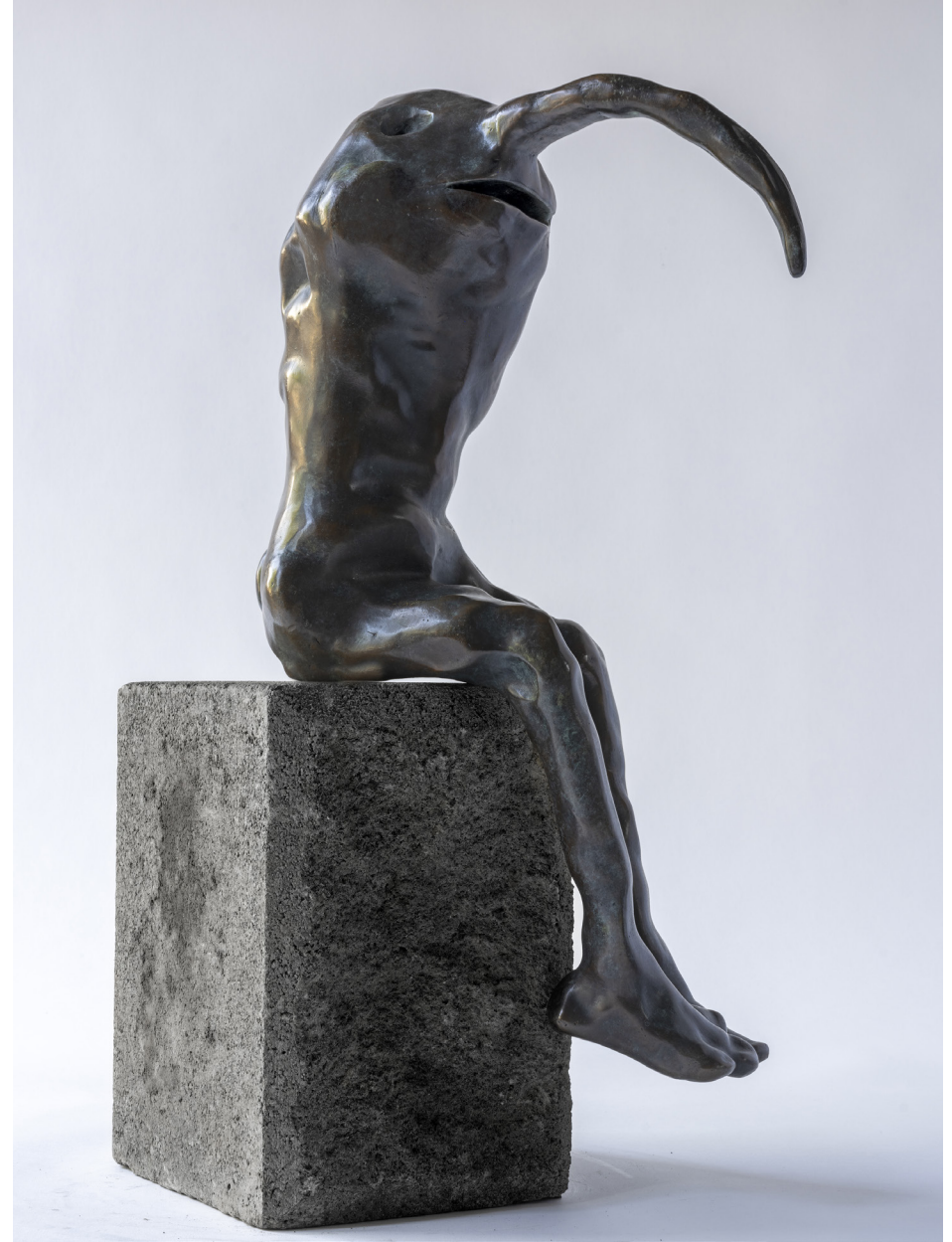
Nebbi, Bronssteypa, 45 cm, 2024