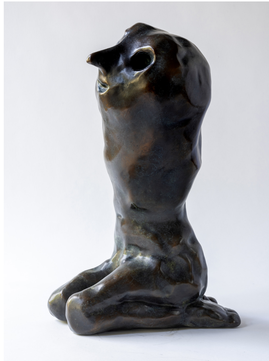
Lóló, Bronssteypa, 50 cm, 2024