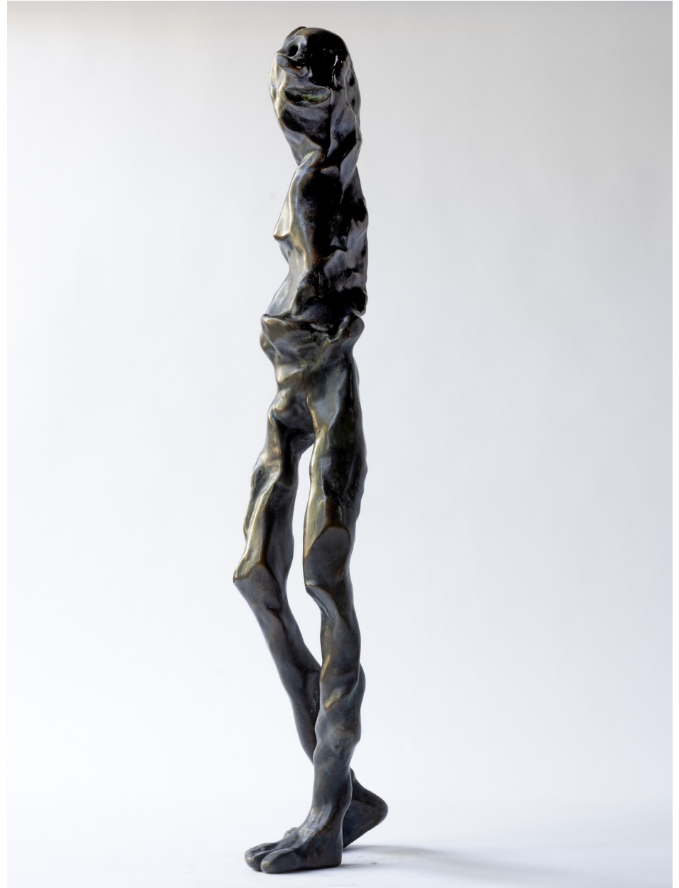
Dinglingur, Bronssteypa, 80 cm, 2024