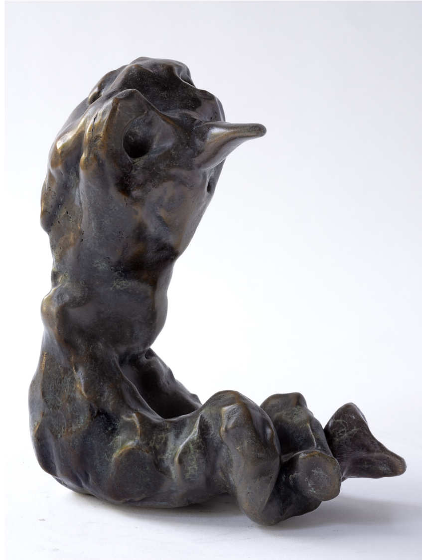
Tísla, Bronssteypa, 25 cm, 2024