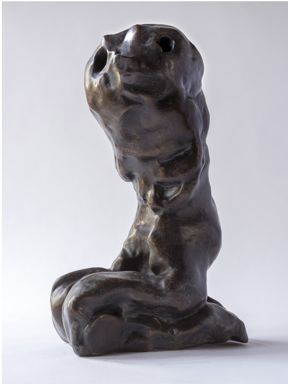
Bimbill, Bronssteypa, 50 cm, 2024