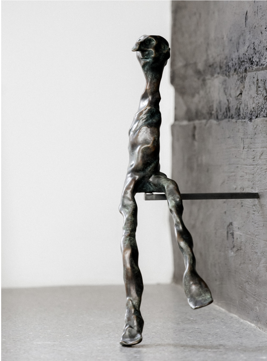
Danglingur, Bronssteypa, 80 cm, 2024